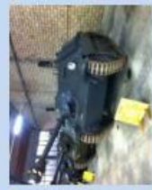
Pz G 13