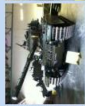
Pz 55 Centurion