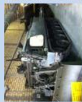
Entp Pz 65