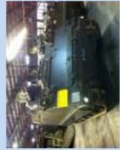
Kdo Pz 63 / 73