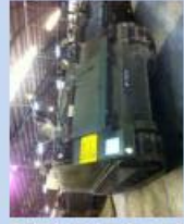
Kdo Pz 63