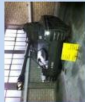
L Pz 51